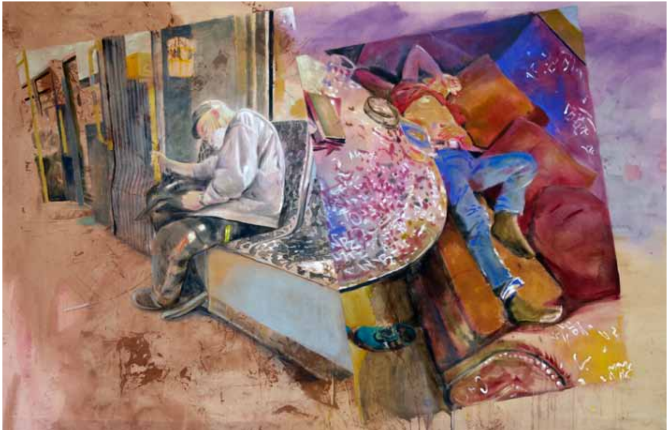
Glücklose Goldsucher, 270 cm x 175 cm