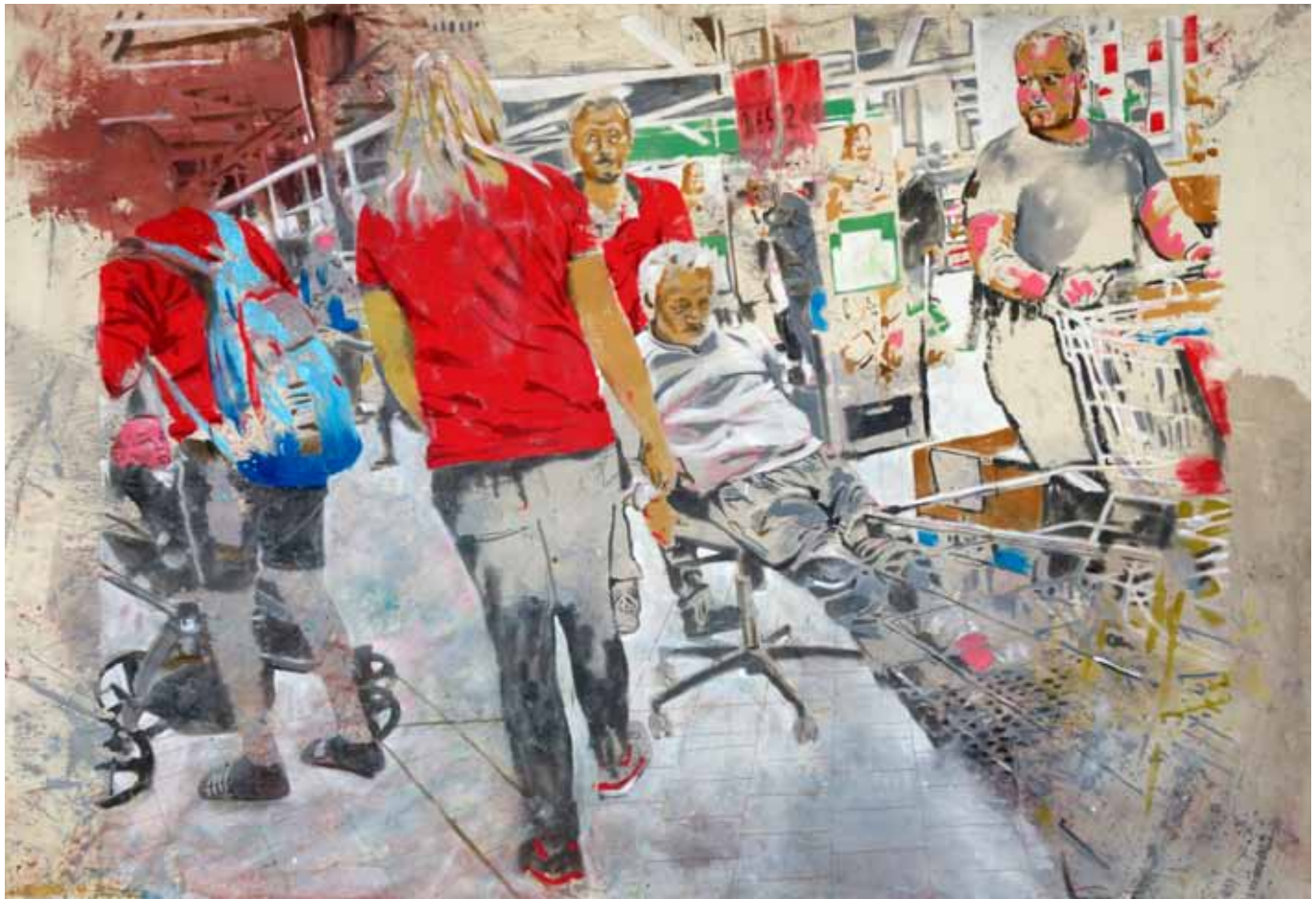
Die Welt, wie er sie bisher wahrgenommen hat, gibt es nicht mehr, 275 cm x 200 cm