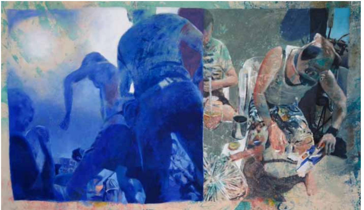
Kult und Rausch, 275 cm x 160 cm