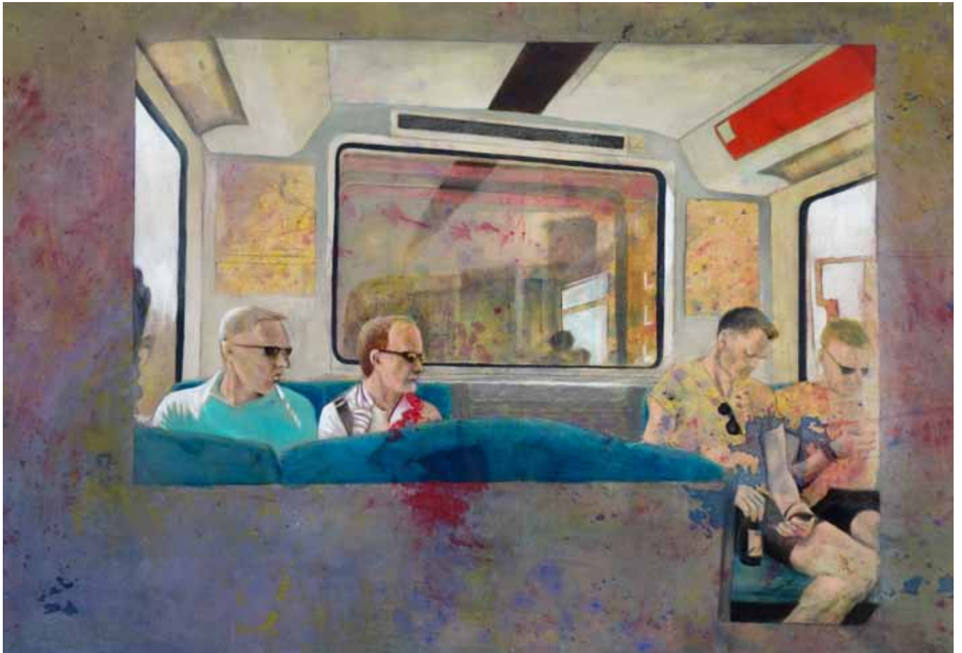
Gemaltes Schutzschild, 270 cm x 130 cm