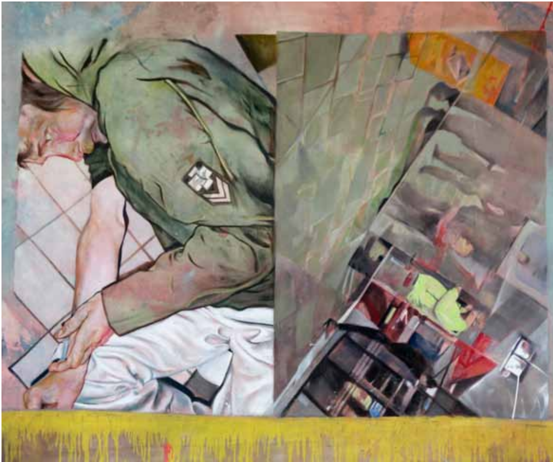
Sucht und Ordnung, 270 cm x 235 cm