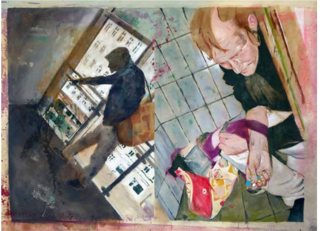
Der verarmte Edelman, 275 cm x 180 cm