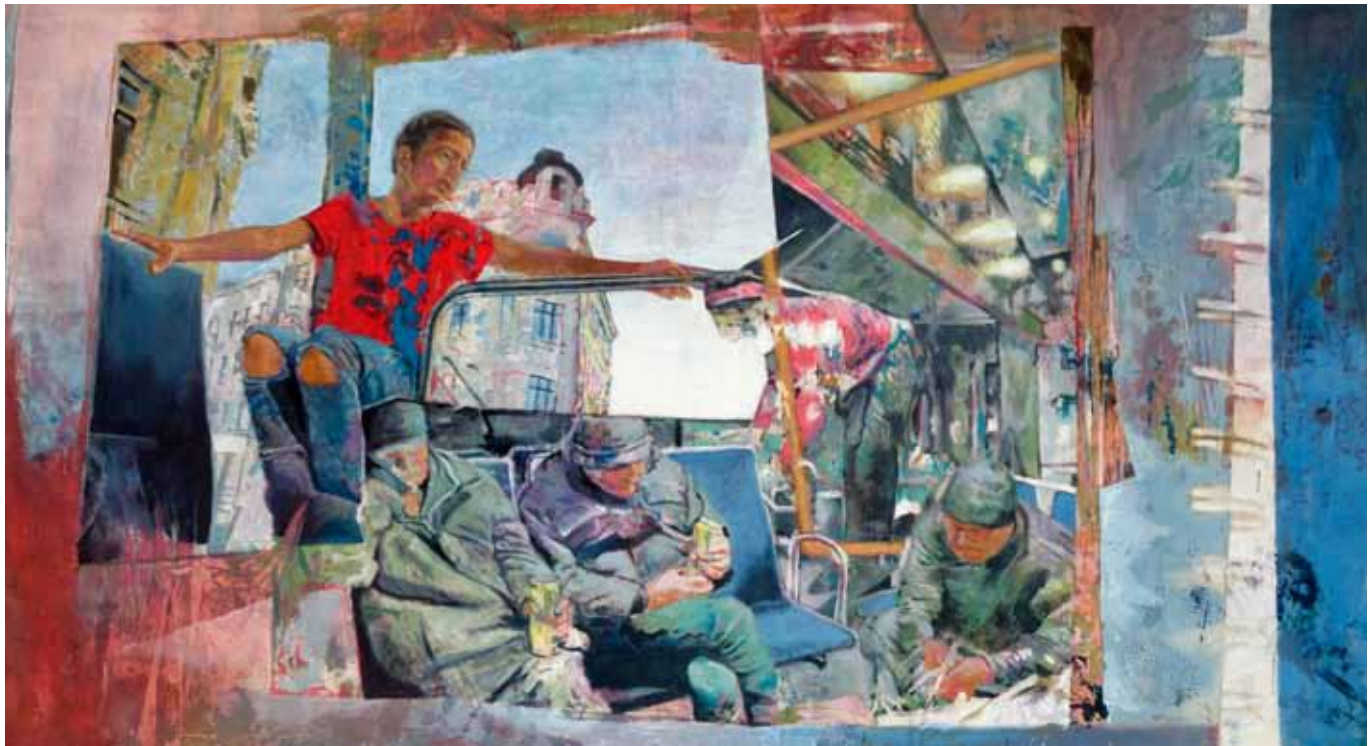
Mut Kraft Disziplin Balance, 275 cm x 135 cm