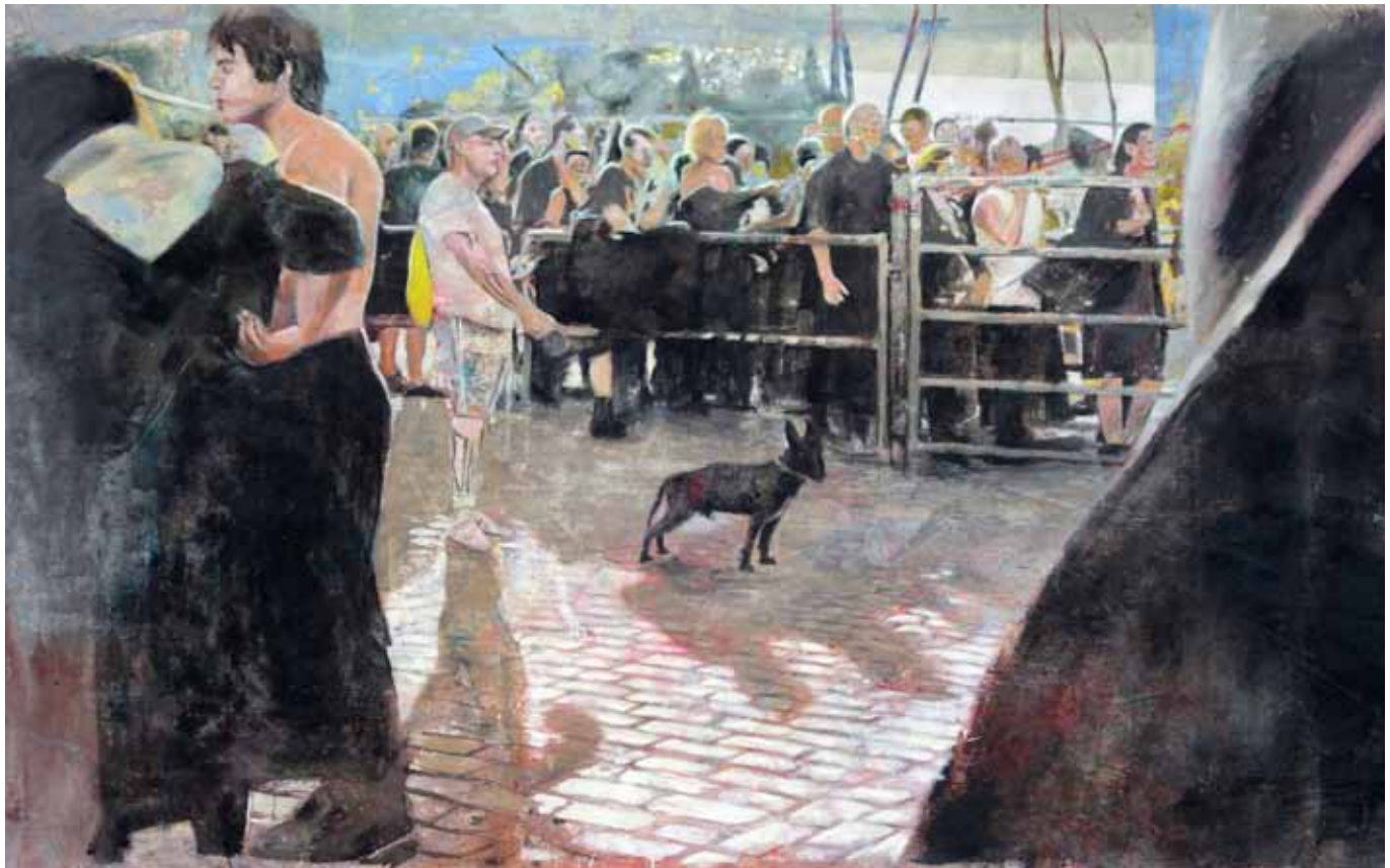
Don't forget to go home, 275 cm x 160 cm