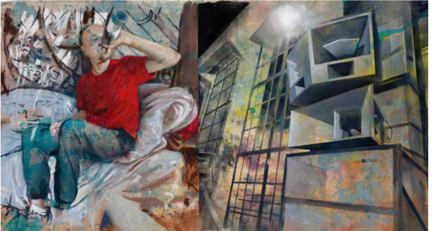
Der Zerfall einer Illusion in farbige Scherben, 275 cm x 140 cm