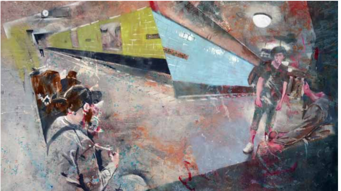
Umstrittenes Schlachtfeld, 275 cm x 155 cm