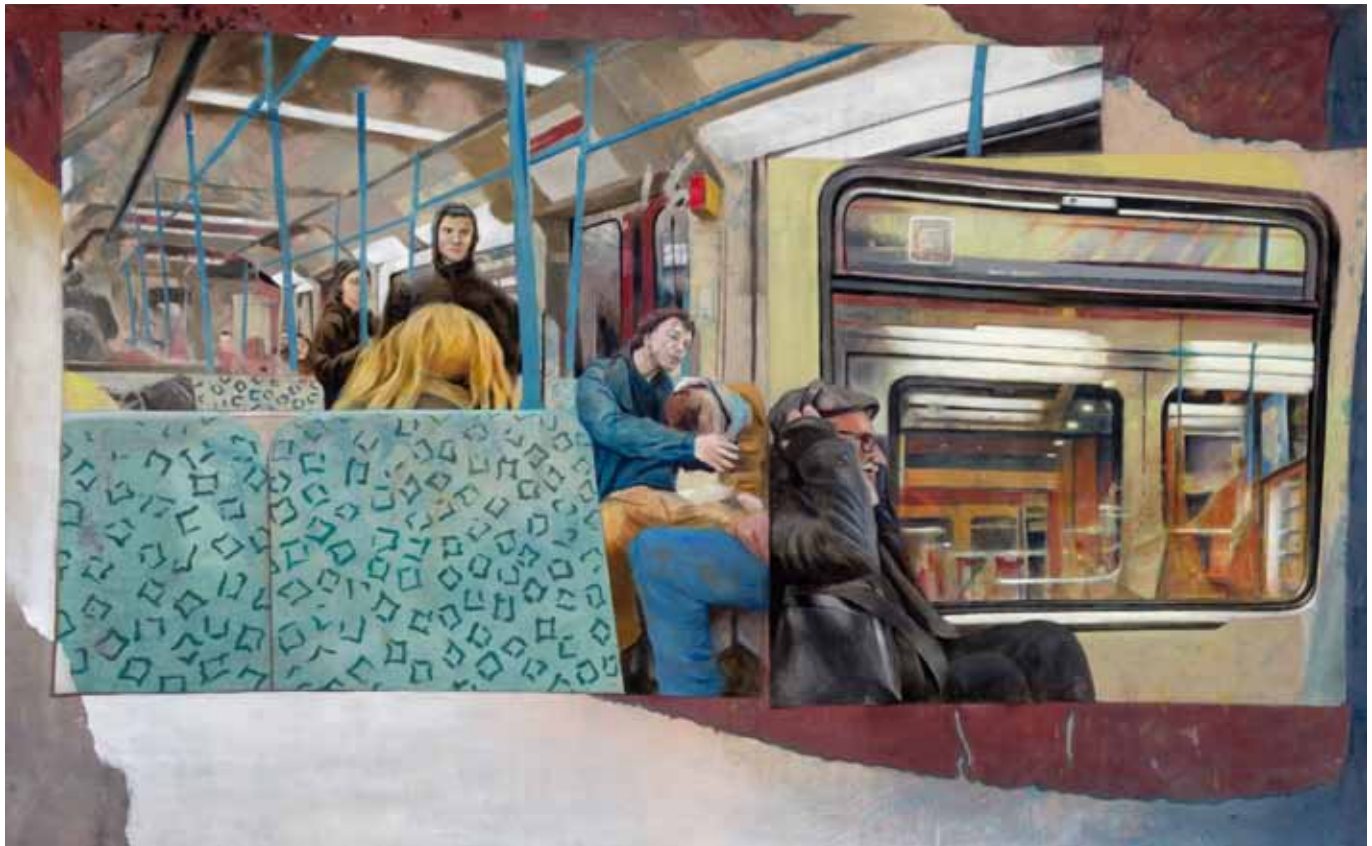
Die Kopfgeburt, 275 cm x 160 cm