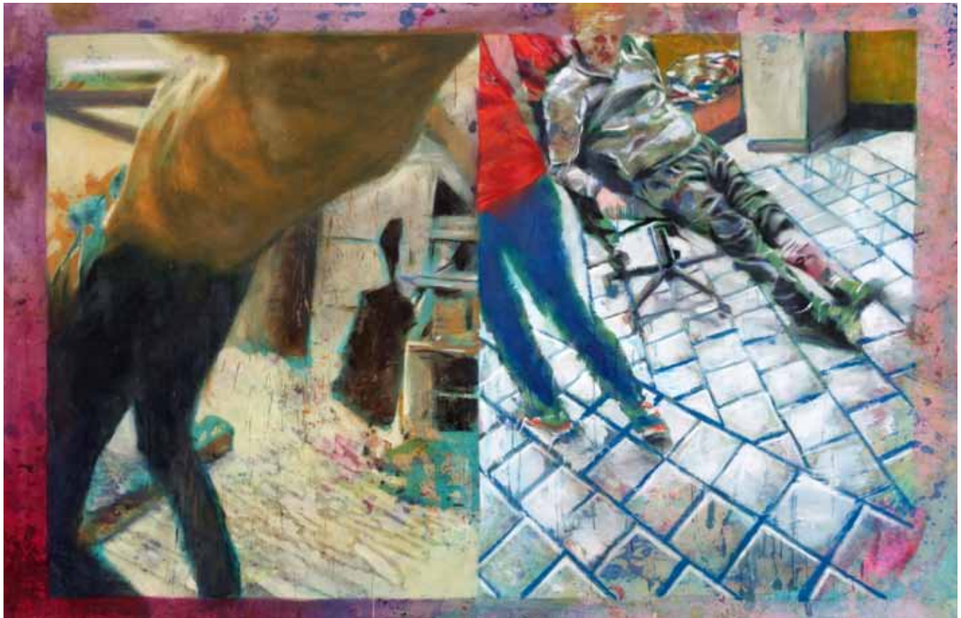
Fleisch, Leistung und Überlegenheit, 270 cm x 170 cm