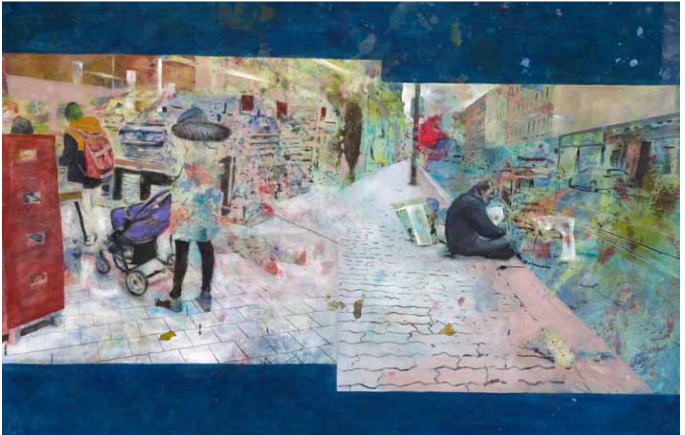
Externe Experten, 270 cm x 165 cm