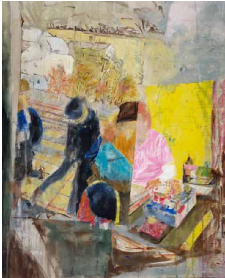
Dieser Traum war mein Winkel mein Geheimnis meine Zuflucht, 210 cm x 275 cm