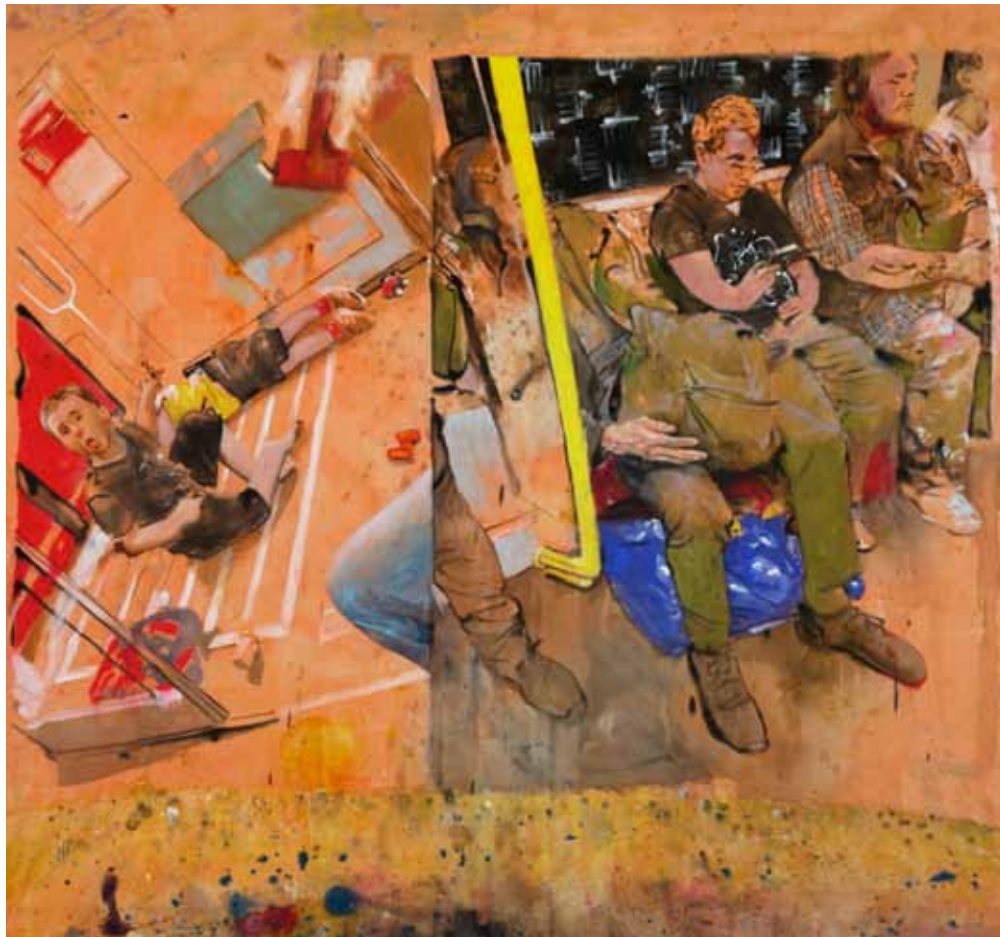
Heruntergebrochen auf das händische Tun, 275 cm x 250 cm