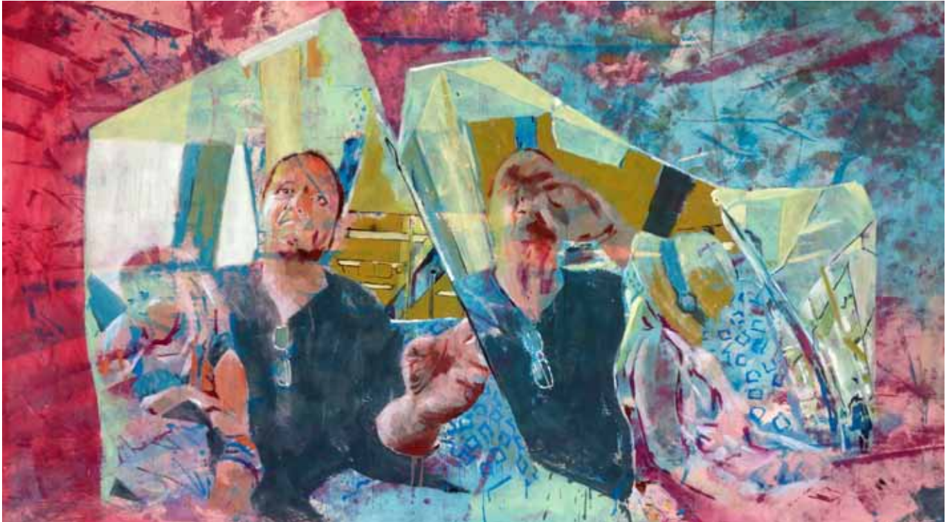
Eine Beobachtung, die ich teilen wollte, 275 cm x 150 cm