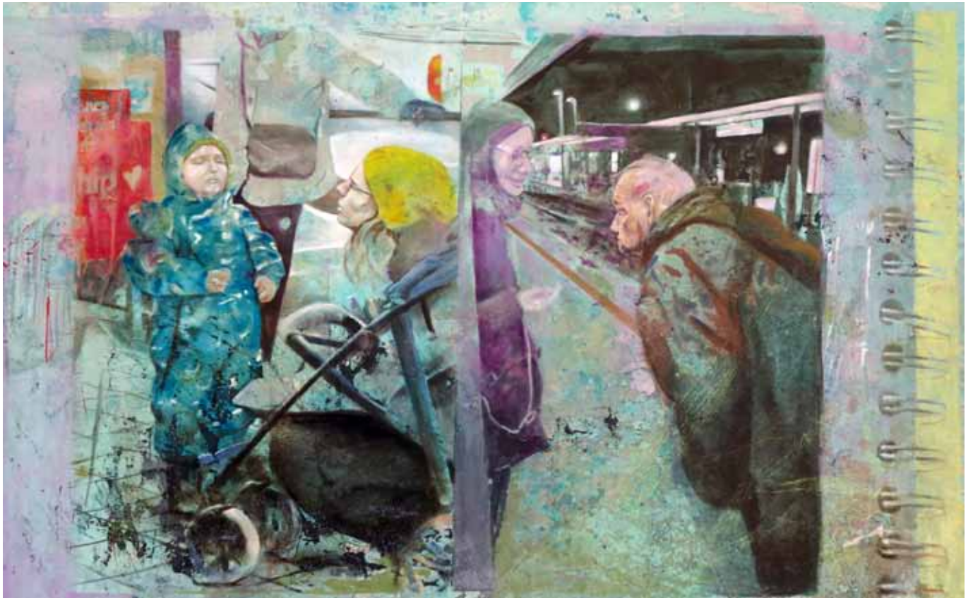
Große Themen in wenig Worten, 270 cm x 170 cm