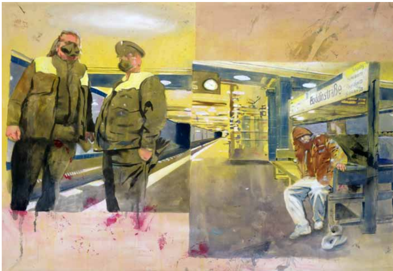
Rituelle Opferhandlungen, 275 cm x 185 cm