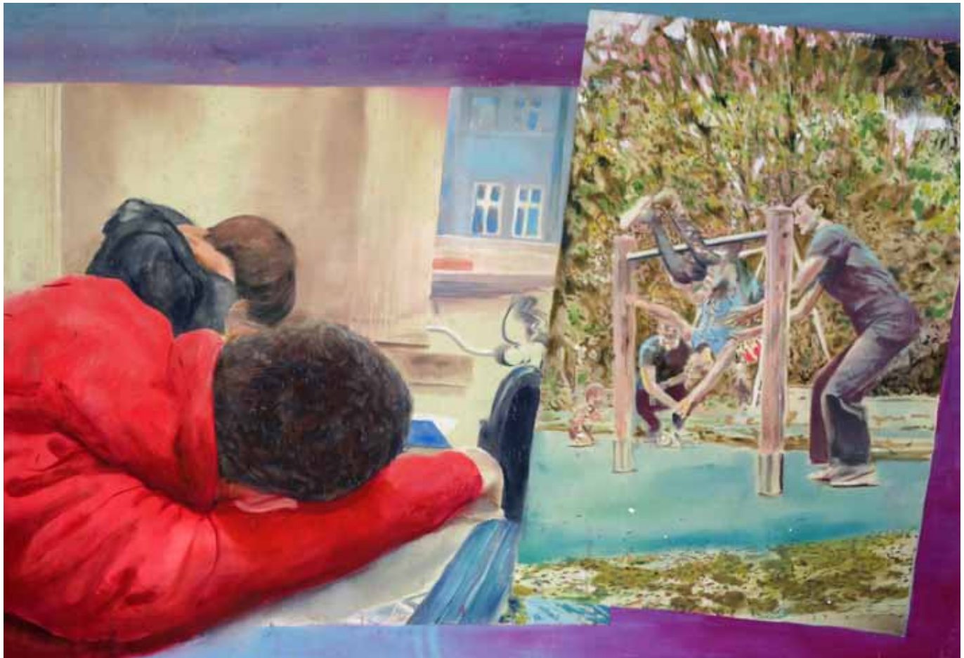
Blutige Ironie, 275 cm x 180 cm