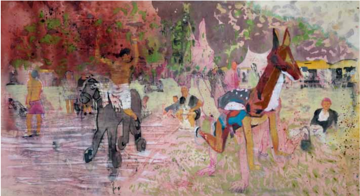
Das Verdecken von Stigmata durch Pfauenfedern, 275 cm x 150 cm