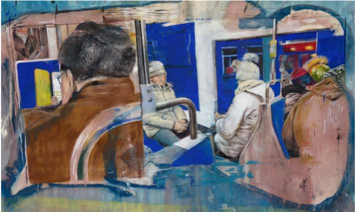
Der ranghöchste Überläufer, 275 cm x 170 cm