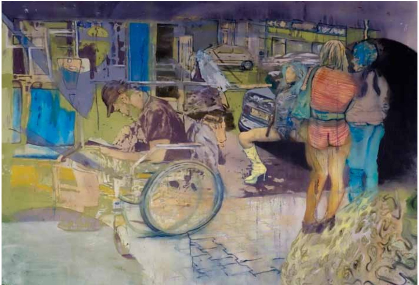
„Die Zeit ist das bewegte Bild der Ewigkeit.“ (PLATON), ca. 275 cm x 230 cm