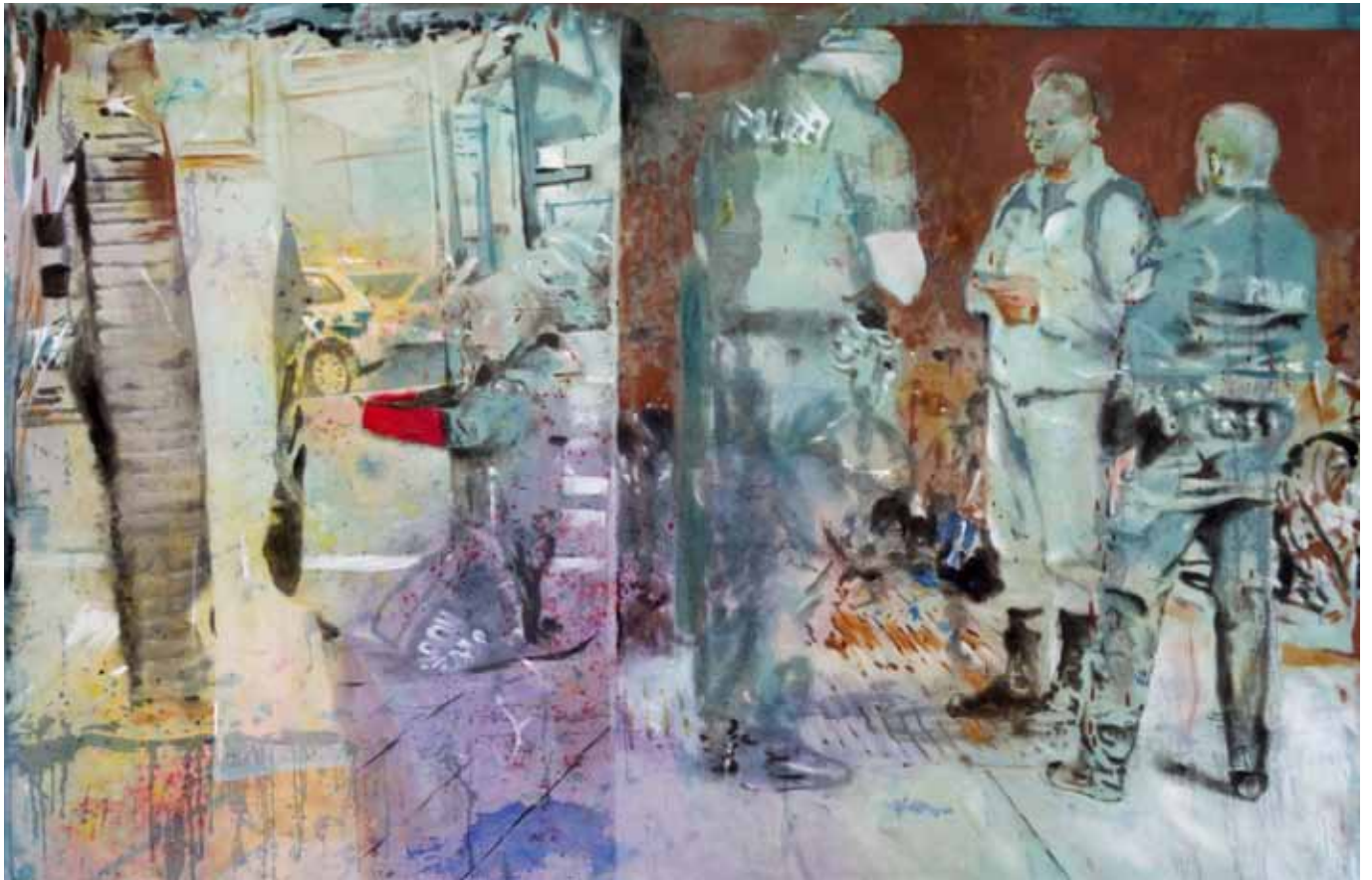
Angst zu Kult, 275 cm x 170 cm