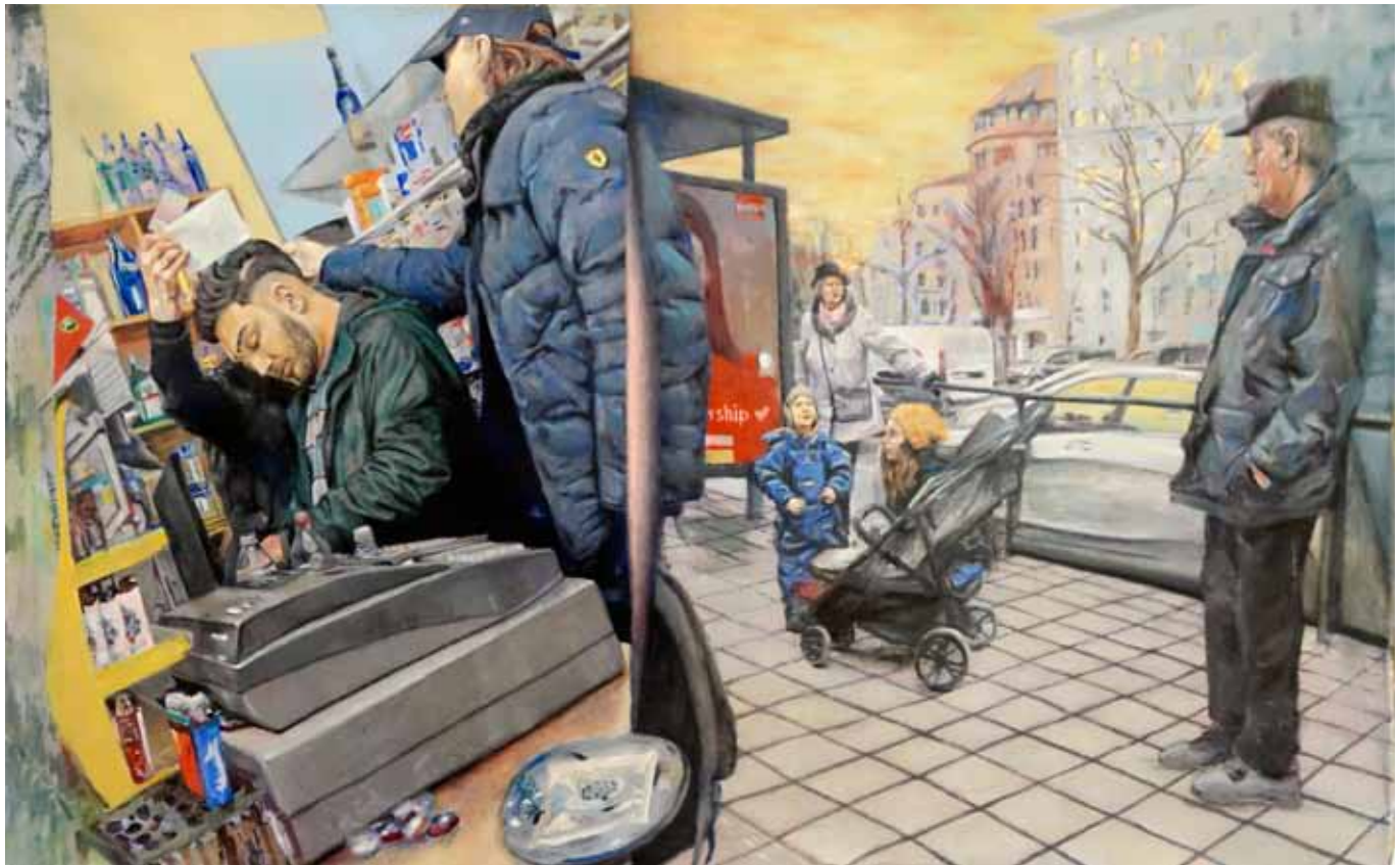
Großstadtkollision, 200 cm x 120 cm