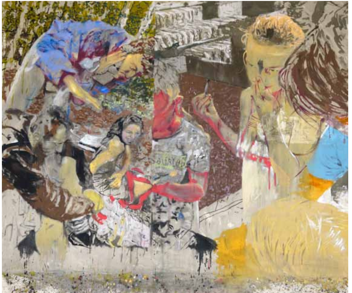
... und Schuld, 310 cm x 270 cm