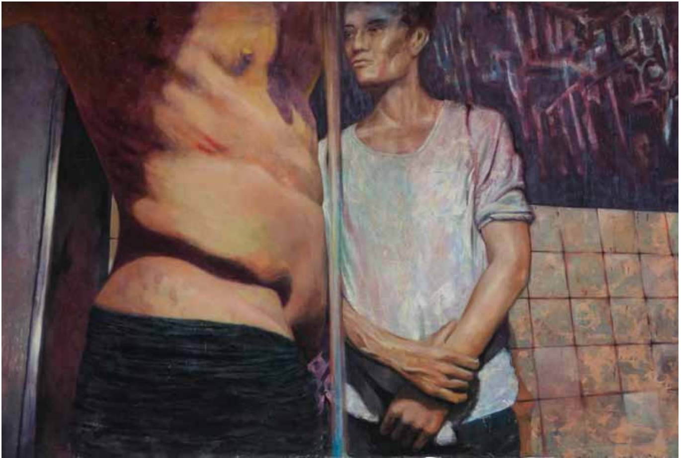
Erst Alter und Tod erklären den Zauber der Jugend, 275 cm x 165 cm