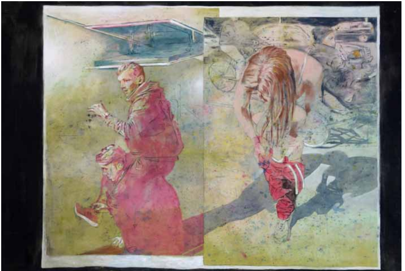
Minimalismus zentriert den Geist, 270 cm x 170 cm